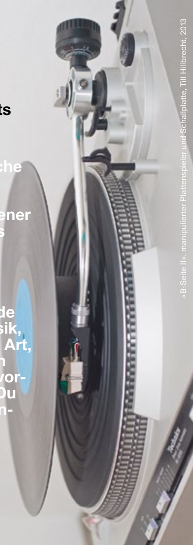
«B-Seite II», manipulierter Plattenspieler und Schallplatte, Till Hillbrecht, 2013

Berner Fachhochschule Haute école spécialisée bernoise